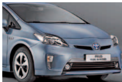
Der Prius Plug-in Hybrid soll mit nur 2,2 Litern (CO 2 : 49 g/km) auskommen. Premiere: 2012

LeasePlan wiederum kann durch die Zusammenarbeit seinen gewerblichen Flottenkunden zusätzliche Lösungen anbieten, die ökologischen und ökonomischen Eigenschaften ihres Fuhrparks zu verbessern. Dies passt offiziell dem Bekunden nach perfekt zu den Ambitionen von Toyota, den Bekanntheitsgrad und die Verbreitung des Vollhybridantriebs weiter zu erhöhen und damit einen wich-