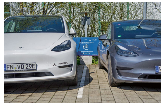
Die Elektrifizierung der Flotte geht schnell voran, die Infrastruktur wächst parallel

„So sind beispielsweise Flüge in Deutschland, Österreich und der Schweiz nicht erlaubt“, erklärt Hilke. Die Bahn-Business-Card ist für viele Mitarbeiterinnen und Mitarbeiter ein fixer Reisebegleiter.