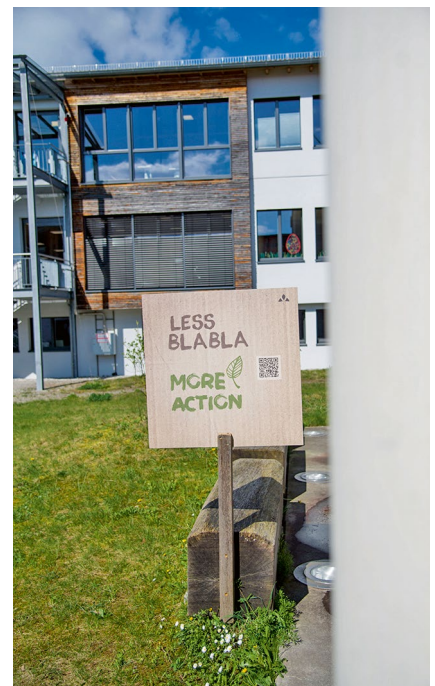
Machen statt nur planen, das ist das Credo in Tettngang und Teil der Firmen-Kultur