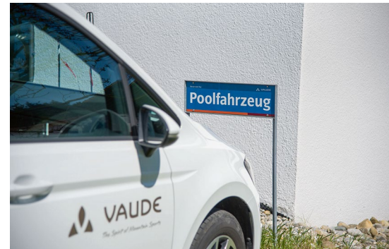
Der Pool an freien Dienstwagen ist recht klein, auch das soll Bahnreisen fördern

Das eint sie mit den Mitarbeitern, die eigene Wege zur Arbeit haben und diese auf unterschiedliche Weise zurücklegen. Die dritte Säule der Mitarbeitermobilität – das Pendeln – ist seit mehr als einer Dekade ein Mix aus Auto, ÖPNV und Fahrrad. Neben dem Jobrad (mehr als 280) als Finanzierungsmodell stellt Vaude eine recht