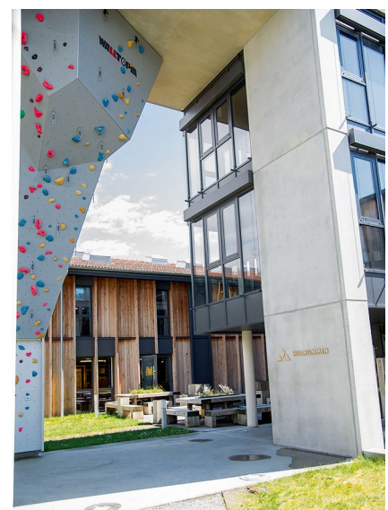
Die Firmenzentrale zeigt auch optisch die Werte: Sportlich, grün, funktional