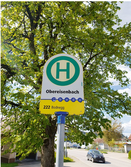
Die Busverbindung nahe der Zentrale fährt nur stündlich. Das soll sich aber ändern