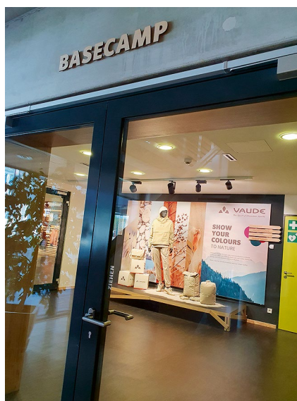
Die Produkte bei Vaude sind nachhaltig. Recycling und Upcycling boomen dabei

Bis zum Jahresende werden 50 der 75 Flottenautos mit Strom betrieben sein. Dass man sich für die Beschaffung der Wallboxen etwa mit gleichgesinnten Firmen in der Nähe zusammentut, funktioniert im Moment noch nicht, aber Jan ver-