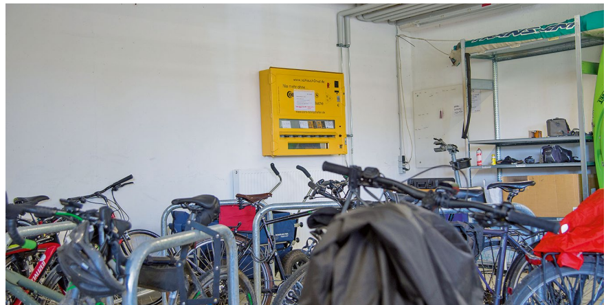
Wer radelt und dabei eine Panne hat, kann vor Ort diese Reparieren