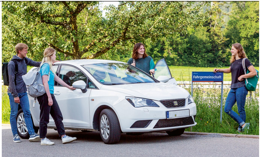
Gemeinsam zur Arbeit zu fahren bringt bei Vaude zahlreiche Vorteile – bis hin zu Prämien

Der dritte, lokale Ideen-Pool ist das Mobilitätsnetzwerk der örtlichen IHK, der gewachsen ist, denn ab einer gewissen Firmengröße und der damit einhergehenden Verpflichtung, das eigene nachhaltige Wir-