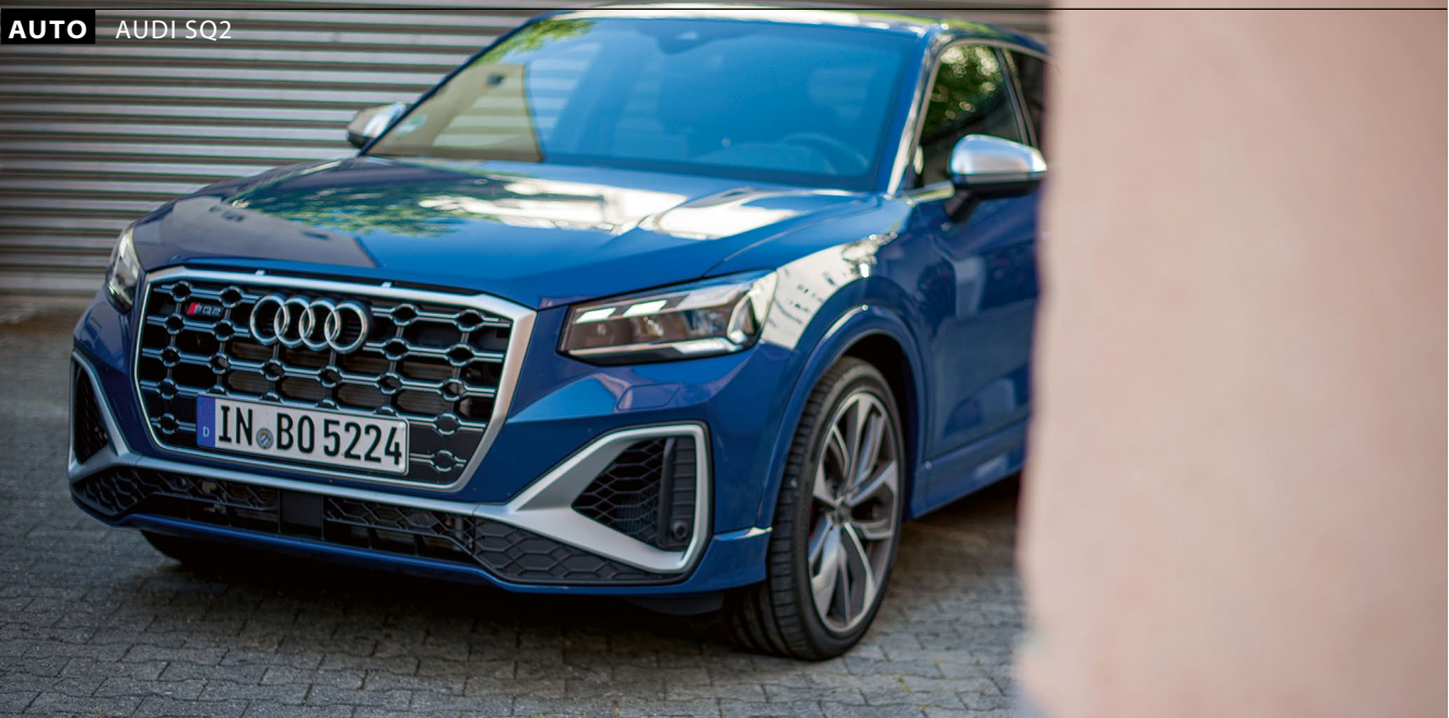
Der Audi SQ2 kann sportlich aggressiv aussehen wie im Foto. Mit dem „Exterieurpaket“ für 1.560 Euro kommt er dunkel-dezent daher.