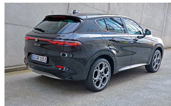
Ins eher beliebige Heck passen unterdurchschnittliche 385 Liter Gepäck.

steht der Sprint auf 18-Zoll-Felgen. Der Testwagen besaß noch die Ausstattungslinie TI, diese gibt es nicht mehr. 20-Zöller – wie bei uns montiert – hingegen schon. Zwar nur noch in Dunkelgrau, aber mit 1.680 Euro Aufpreis sowieso keine Empfehlung. Nach dem ersten Bordsteinkontakt sehen sie unschön aus und kosten am Leasingende richtig Geld. Empfehlenswert sind hingegen die schwarzen Ledersitze, die es nur in Kombination mit dem Winter-Paket und dem Veloce-Paket für zusammen 2.522 Euro gibt. Ein Vorteil des Plug-in-Hybriden: Nach wie vor versteuert der Dienstwagenfahrer nur die Hälfte des Bruttolistenpreises – da hat das Förderende noch nicht gegriffen – kommt aber sicherlich auch noch. tb