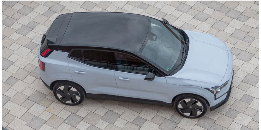
Ein Glasdach, das man hier nicht erkennt, gibt es nur im „Ultra“.

Am 18. April findet in Ingolstadt der Autoflotte Fuhrparktag statt. Neben Vorträgen zu den Themen ESG, UVV, Autonomes Fahren und KI haben Sie dort die Möglichkeit, den EX30 über rund 100 Kilometer zu fahren. Dreh- und Angelpunkt ist das Brigk, Anlaufstelle für Kreative in der Audi-Stadt. Anmeldung: autoflotte.de/volvo_mb