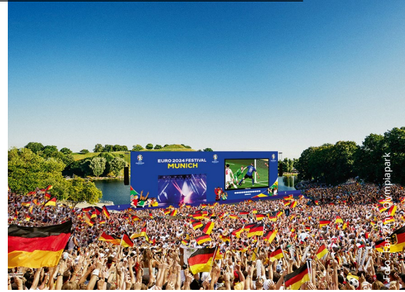
Zu den Fan-Meilen kann man auch nachhaltig anreisen.

sind kurze Anreisen. Der Spielplan gibt viele Optionen her, nachhaltig zu reisen.“ Mit dem besonderen Bahn-Angebot will man neue Maßstäbe in Europa setzen. Bahn-Vorstand Peterson hofft, dass künftig mehr Teams die Bahn dem Flugzeug vorziehen: „Hier könnte die Fußball-EM einen guten Anstoß geben.“ Thomas Flehmer