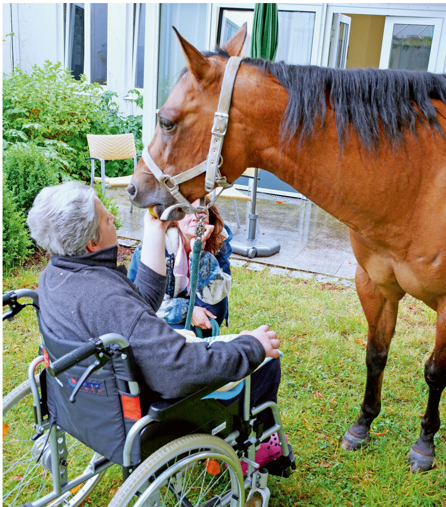
Ein letzter Wunsch ging hier in Erfüllung: der Abschied vom geliebten Pferd.

oder per Fax-Anmeldung vor. In einem gemeinsamen Gespräch wird dann entschieden, ob wir die richtige Stelle für diesen Patienten sind. Auch Angehörige können für Patienten anfragen, es bedarf aber stets des zusätzlichen Kontakts mit dem behandelnden Arzt. Wir entscheiden dann die Aufnahme nach der medizinischen Notwendigkeit. Patienten, die zu Hause sind und in Not, werden schneller auf der Palliativstation aufgenommen als Patienten, die in stationären Einrichtungen versorgt sind.“