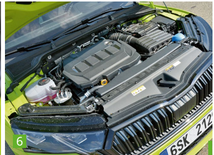
1 Aufgeräumt gibt sich der Flottenliebling im Inneren. 2 Es gibt das Infotainmentsystem im Octavia mit 10- und mit 13-Zoll-Display 3 Die digitale Instrumententafel gibt zahlreiche Infos, etwa zum Verbrauch. 4 In der zweiten Reihe ist der Gast König, was den Platz betrifft. Die Mittelablage ist neu und bietet USB-Anschlüsse. 5 Eine gute lange Fahrt braucht stets gute Sitze. Diese bietet der Kombi an. 6 Der 2,0-Liter-Diesel und der 1,5-Liter-Benziner sind gleich stark.

uns gefahrenen Variante Sportline stehen zusätzlich Matrix-LED-Scheinwerfer der zweiten Generation zur Verfügung.