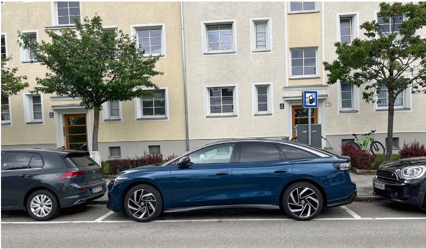
Mit 4,96 Metern passt der ID.7 nicht auf die Ladesäulen-Stellfläche in München. Dafür ist der Wendekreis mit unter elf Metern klein – man kommt gut raus.

Im Mittel lud „unser“ ID.7 am HPC (High Performance Charger) mit fast 130 kW, bei einem Akkustand von gut 60 Prozent waren es stets mehr als 110 kW, die in den Speicher gepumpt wurden. In der Regel steht man also bei einer Ladung von 10 auf 80 Prozent weniger als 30 Minuten. Das Schöne: Die Strecke dazwischen kann je nach Fahrweise sehr weit sein. Denn die gute Aerodynamik und der effiziente Heckantrieb spielen Langstreckenfahrern in die Karten.