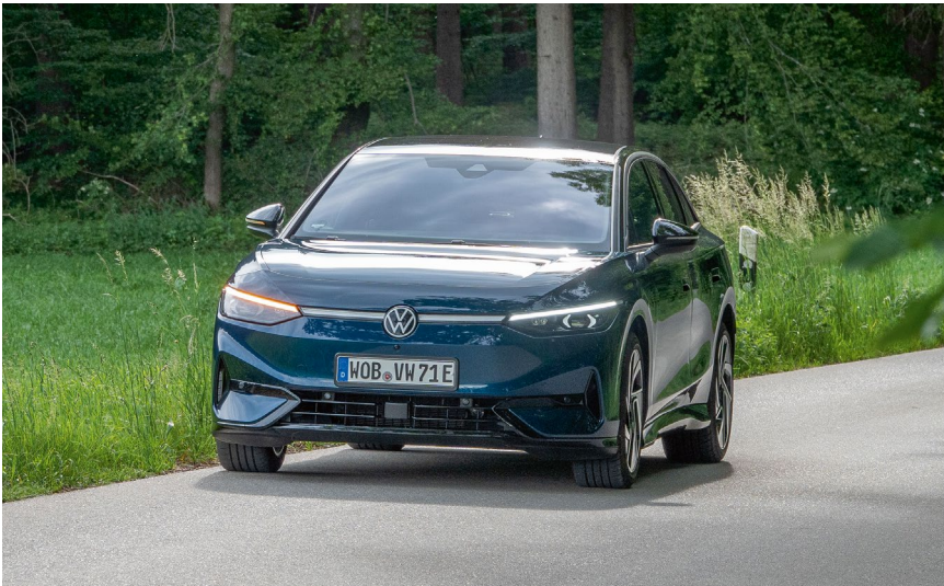
Der ID.7 ist eine gute Reiselimousine – komfortabel, leise, sparsam.

2,2 Tonnen Gewicht. Mehr ist Überfluss. Beim ID.7 gibt es den aber in Form des ID.7 GTX (86 kWh/340 PS/ Allrad, 6.471 Euro Aufpreis).