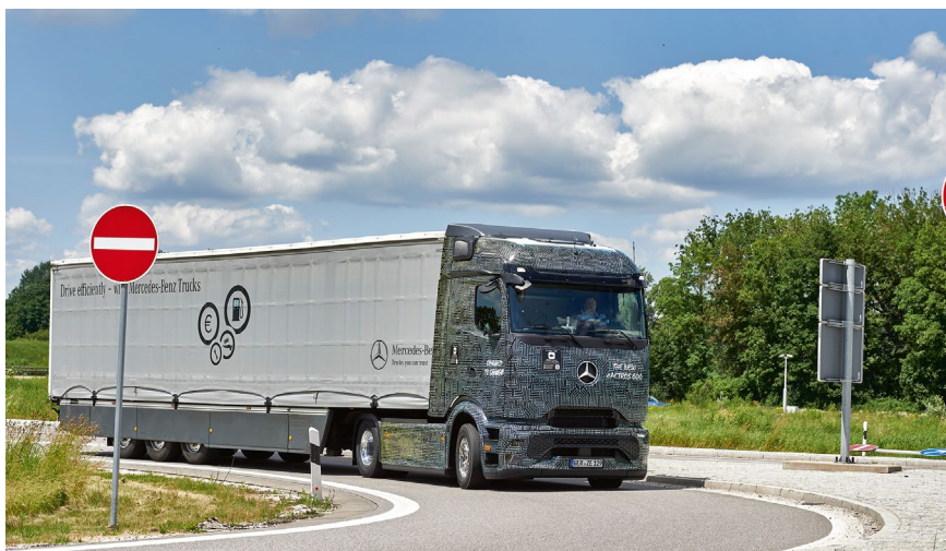
Mercedes eActros 600: gute Reichweite, moderne Akkutechnik, vorbildliche Assistenzsysteme.

Anders als Iveco, setzt Daimler Truck allerdings auf ein Getriebe, genauer ein selbst entwickeltes Viergang-Planetengeräte. Und führt für dessen Existenz die gleiche Begrün-