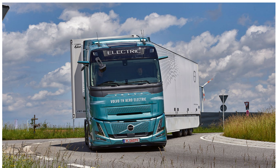
Volvo FH Aero Electric: Top-Lomfort, leise, gute Bedienbarkeit.

Es wird sich zeigen, welcher der beschriebenen Wege der wohl sinnvollste ist – oder ob weiterhin diese Vielfalt bestehen bleiben wird. So oder so: Auch bei den Lkw geht es in Richtung E-Mobilität – langsamer als bei den Pkw, doch das kennt man ja von der Straße bereits. Das Erweitern der CCS-Ladeinfrastruktur für Lkw an Autohöfen hat bereits begonnen. J. Burgdorf