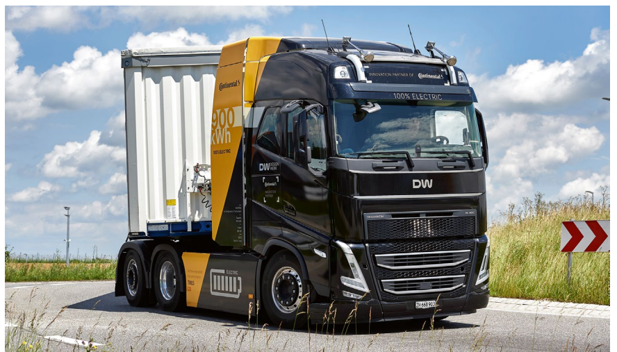
Designwerk HC 900 E: hohe Batteriekapazität und damit ausdauernde Reichweite, super Rekuperationspedal.

erwarb. „Wir machen das, was die großen Fahrzeugbauer nicht können – oder nicht können wollen,“ erklärt uns der bei den Testfahrten mitrei-sende Firmenvertreter. Was damit ge-meint ist, offenbart der HC 900 E so-fort. 900 Kilowattstunden Speicher sind am Testfahrzeug verbaut, in Li-thium-Ionen-Batteriepacks à 225