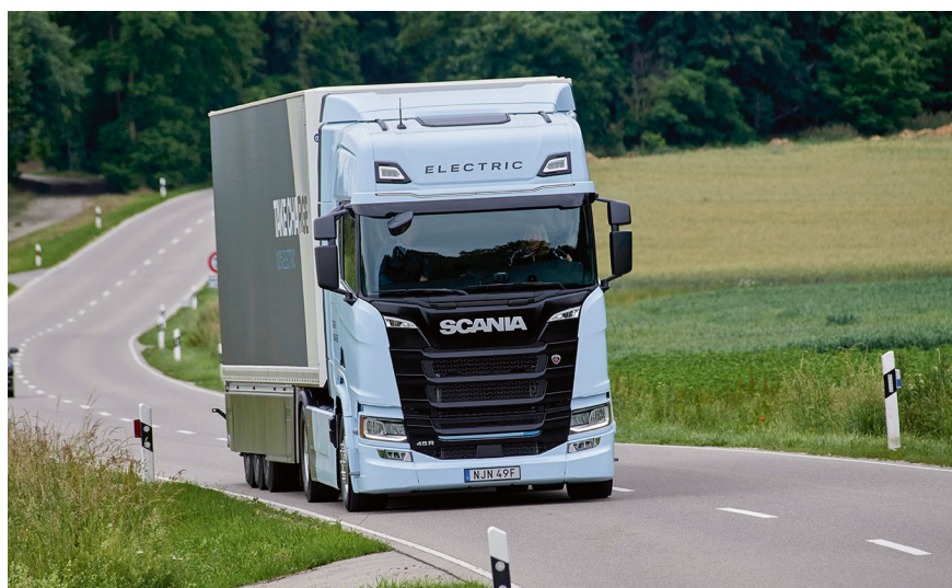
Scania 45 R: komfortabel, leise, gute Reichweite, seidenweiche Gangwechsel.

Bleibt noch einer im Test-Sextett, den man ohne Frage als Pionier in Sachen E-Mobilität im Schwer-Lkw bezeichnen darf. Schließlich lieferte Volvo Trucks seine E-Modelle schon an Kunden aus, als der Wettbewerb noch mitten in der Entwicklung steckte. Entsprechend viele Volvo FH- und FM-Electric sind bereits auf den Straßen unterwegs, was den Göteborgern einen klaren Erfahrungsvorteil bringt.