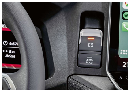
Die E-Feststellbremse verfügt auch über eine „Auto-Hold“-Funktion.

Eine, den Maschinenraum betreffende Einschränkung bringt das neue Modelljahr allerdings ebenfalls mit sich. Der dort weiterhin arbeitende Common-Rail-TDI mit zwei Litern Hubraum wird nämlich um seine bis-