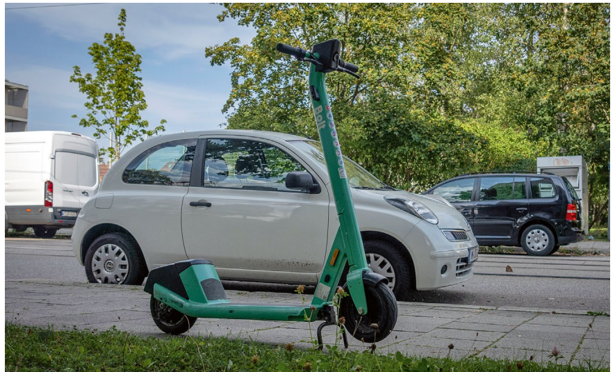
Wer E-Scooter nutzt, sollte sich über die Regeln im Klaren sein.

Dies ändert jedoch nichts an der Tatsache, dass es sich bei E-Scootern, Segways und anderen Fahrzeugen im Sinne des Paragraph 1 eKFV um Kraftfahrzeuge handelt (vergleiche BT-Drucksache 158/19, Seite 1; BayObLG, Beschluss vom 24.7.2020, Az. 205 StRR 216/20).