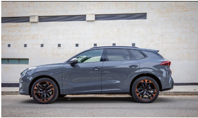
Gut 4,50 Meter lang und damit ausreichend Platz innen.