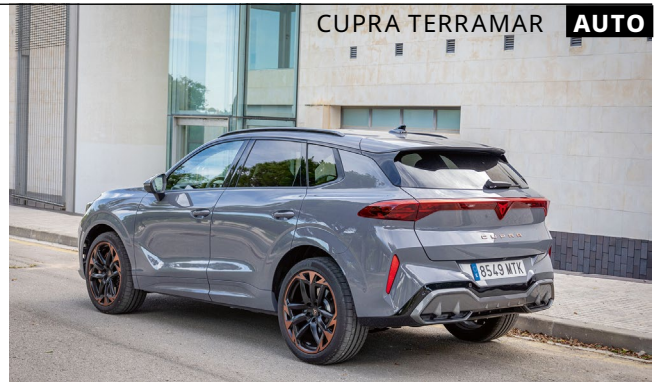
Der Terramar ist optisch „laut“ – wie alle Cupra-Modelle.

suggestieren, kennt man bereits von anderen Modellen der Spanier. Weil der Bezug zum Namen „Terramar“ nicht fehlen darf, spannt sich ein markanter Bügel über der Mittelkonsole und soll – mit etwas Vorstellungskraft – an den Kiel eines Segelbootes erinnern. Eine Etage höher wird es praktischer: Der 12,9-Zoll-Touchscreen dient als zentrale Steuerungseinheit und ist ein vertrauter Anblick. Für 865 Euro Aufpreis gibt es im Digital-Drive-Paket ein virtuelles Cockpit, Head-up-Display und Navigationssystem.