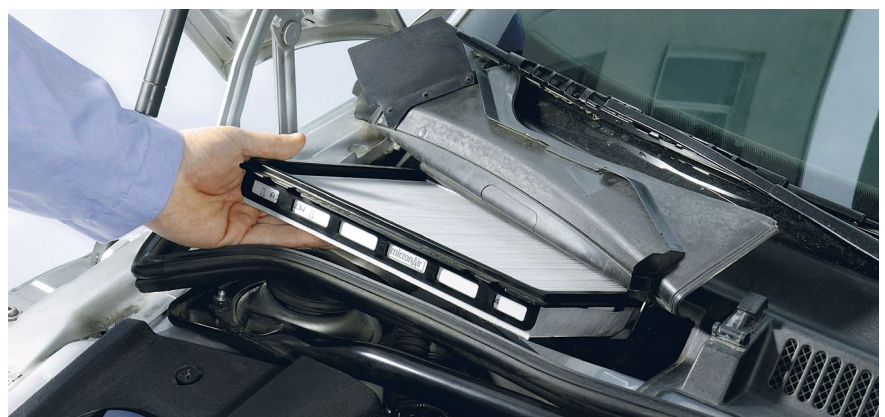
Regelmäßig erneuern: Der Innenraumfilter sammelt unerwünschte Schadstoffe.