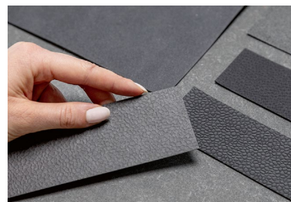
Metamorphose zum strukturierten Oberflächenmaterial: Industriehanf als Basismaterial.

ins Spiel. Hinter diesem Begriff verbirgt sich die Frage, ob das Material auch in der benötigten Masse verfügbar ist, ohne dass dafür andere wichtige Umweltaspekte vernachlässigt werden. Als Beispiel erwähnt der Materialforscher einen zugleich anschaulichen und bedrohlichen Aspekt: Denn es hätte absolut keinen