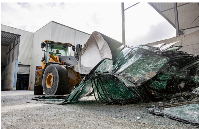
Die alten Windschutzscheiben werden natürlich recycelt, das gehört nicht nur wie hier bei Audi längst dazu.

Fertig ist ein Schlüsselanhänger, den man gern in die Hand nimmt – auch wenn man selbst keinen GTI in der Garage hat. Klaus Brieter