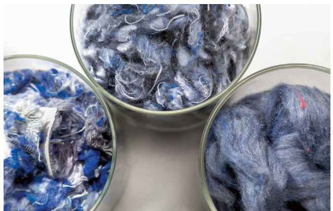
So sieht geschredderte Arbeitskleidung aus, bevor sie zum Stoff für Autositze verwandelt wird.