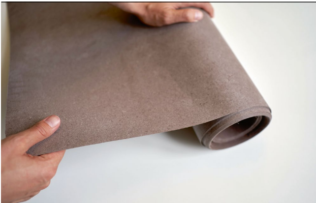
Macht als Oberflächenmaterial einen qualitativ echt guten Eindruck: Polypropylen.