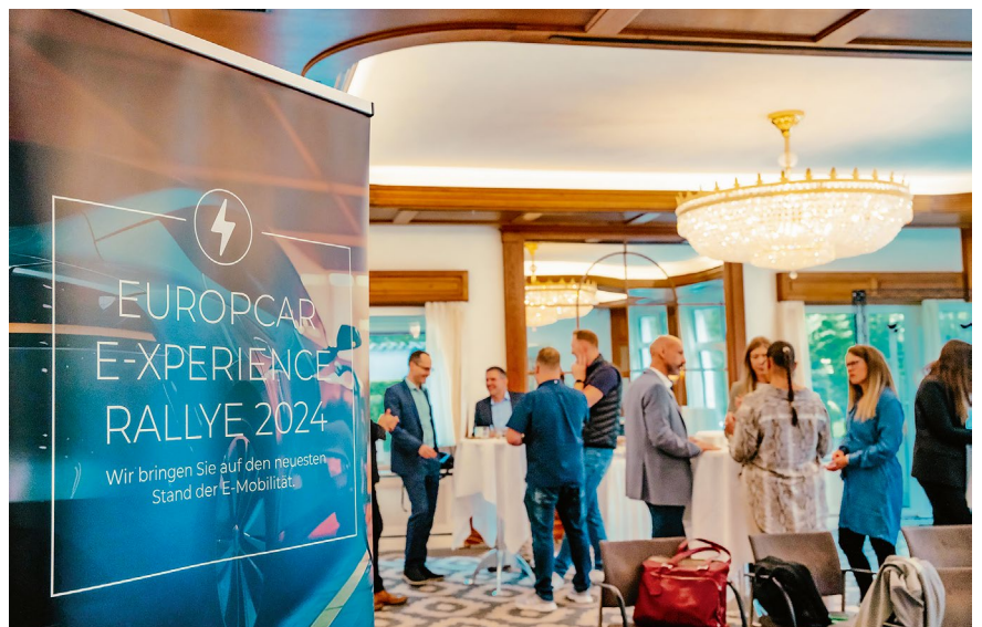
Nach dem Austausch ging es mit der Testflotte an Stromern auf die Touren.