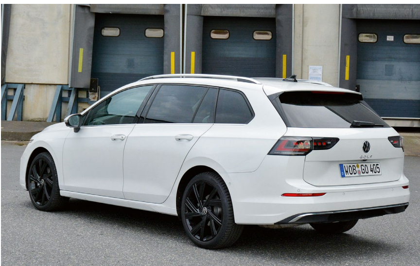
Ein Kombi sollte ein Lade- und Langstreckenmeister sein. Beides erledigt der Golf Variant gewohnt souverän – gerade in der achten Generation.

Das hat allerdings auch seinen Preis, für den Testwagen werden fast 50.500 Euro aufgerufen, der VW Golf Variant Style 2.0 TDI steht in vernünftiger Grundausstattung ab 35.900 Euro in den Preislisten. tbü