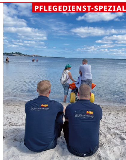
Eckernförde und generell das Meer stehen als letzte Orte hoch im Kurs.

Geplant ist es, den Wünschewagen etwa zehn Jahre zu fahren. „Erfahrungsgemäß halten die das auch durch. Im Schnitt fahren wir 25.000 Kilometer