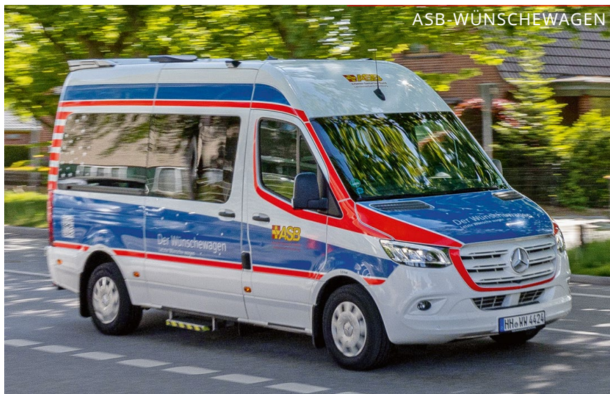
Der Wünschewagen ist ein nach Wunsch gefertigter Rettungswagen – nur schöner.

nur besser, sondern vor allem auch schöner gemacht. Denn ganz wichtig ist dem Team, dass sich die Menschen an Bord wohlfühlen und nicht wie in einem Rettungsfahrzeug, was der Wünschewagen technisch ist.