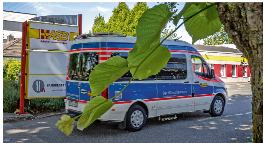
In Hamburg-Wandsbek ist der ASB mit dem Wunschewagen stationiert.