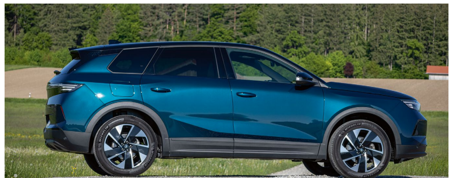
4,65 Meter ist der aktuell längste Opel (Nutzfahrzeuge außen vor).

Das Schöne: Das Lächeln vergeht den meisten auch beim Betrachten des Kompakt-SUV nicht. Der in Eisenach produzierte Grandland ist zwar nicht spektakulär gestaltet, aber auch nicht langweilig. Und viele erkennen noch immer den Opel im SUV-Einerlei. Warum man auf den Blitz am Heck verzichtet und diesen mit einem rot hinterleuchteten OPEL-Schriftzug „ersetzt“, bleibt ein Geheimnis.