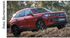
König Tiguan. Der Flottenchampion verliert an Boden, grüßt aber von ganz oben.