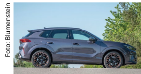
Cupras neues E-SUV, der Terramar, entpuppt sich als Volltreffer.

Die Iberer landen auf dem hervorragenden sechsten Rang.