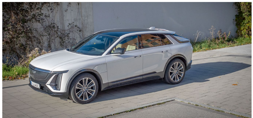
Knapp fünf Meter lang und fast zwei Meter breit zeigt sich der US-Boy.

Und wenn die Post beim Caddy abgeht, dann sollte alles an seinem Platz bleiben. Die Frage nach der per-