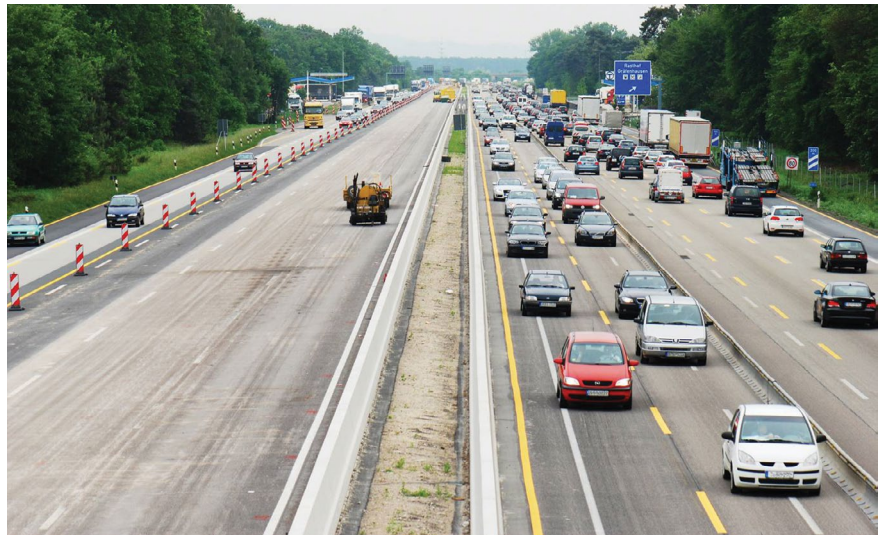
Wenn die Fahrbahn abgefräst wird, bleibt oft Rollsplitt: mal mehr, mal weniger.

Das haftungsrechtliche „Schlupfloch“ liegt allerdings in der ebenfalls bestehenden Verpflichtung, Rollsplitt als Gefahrenquelle erkennbar zu machen; womit wiederum eine ordnungsgemäße (Warn-)Beschilderung ins Spiel kommt. Dennoch finden sich in der Rechtsprechung vereinzelt Urteile, die Auto- und/oder Motorradfahrern Ansprüche auf Schadenersatz im Falle von Unfällen wegen unsach-