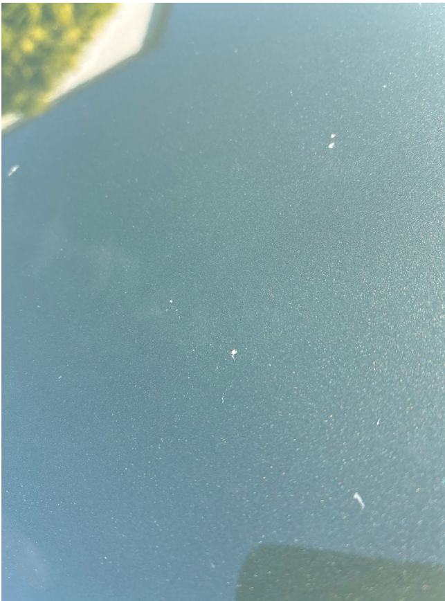
Steinschläge auf der gesamten Front nach Baustellenfahrt.