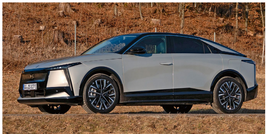
Der DS 8 hat eine ordentliche Ladekurve, die Langstrecken erträglich macht.